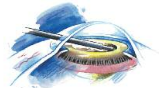
Absaugen der Linsenreste