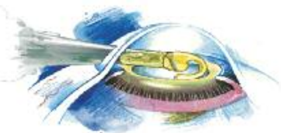
Einsetzen der Kunstlinse

auskommen. Jedoch ist in der Regel weiterhin eine Lesebrille nötig. Viele Menschen wollen aber auch nach der Operation nicht auf ihre Gleitsichtbrille verzichten. Mit speziellen Verfahren können geeignete Augen eine vollständige Brilfenfreiheit erreichen.